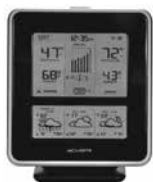
Estaciones del Tiempo